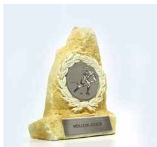
Placas de trofeo