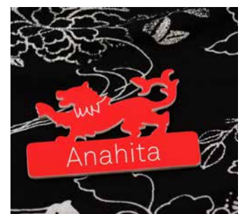
Placas de identificación