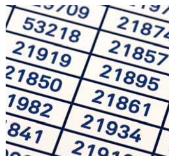
Pequeñas etiquetas y placas