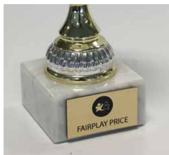
Placas de trofeo