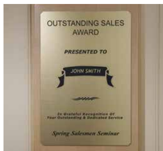
Placas de homenaje