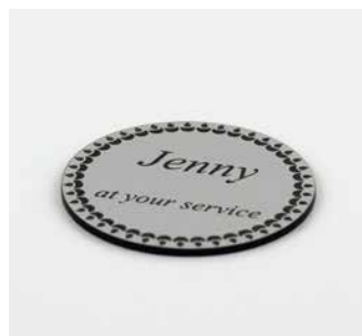
Placas de identificación