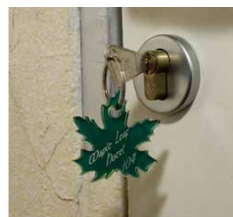
Regalos y decoración