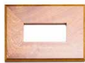
Soporte de madera