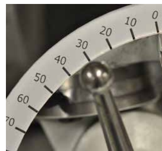
Herramientas de medición