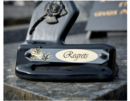
Grabado de placas y artículos funerarios