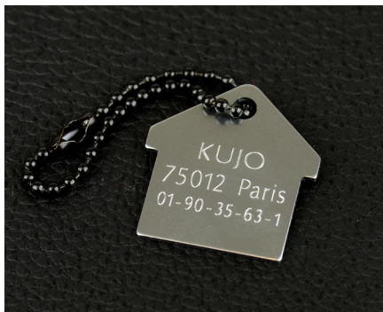
Grabado de medallas y chapas de mascotas