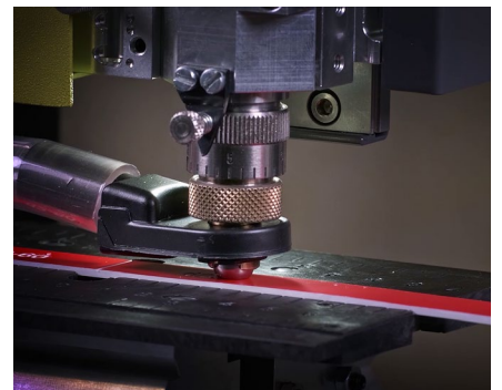
Placas de identificación y pequeña rotulación