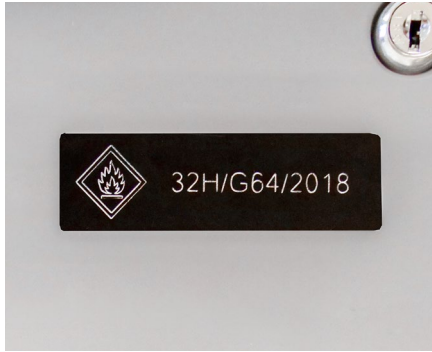
Marcaje para identificación y trazabilidad de equipos industriales