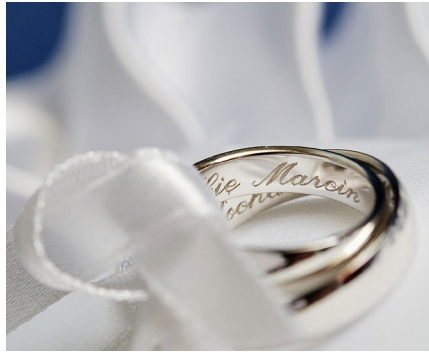
Personalización y grabado de joyería