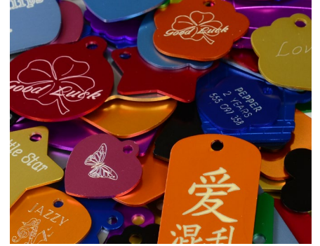
Gravado de placas de identificación para mascotas y perros