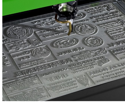
Gravado y corte por láser de sellos de tinta personalizados