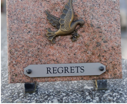
Gravado de placas funerarias y lápidas