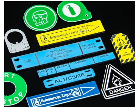
Etiquetas de identificación