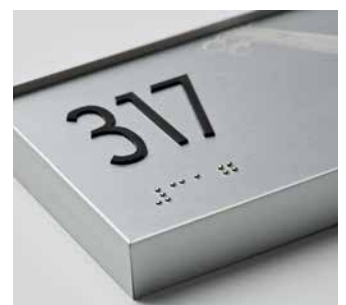
Señalización braille y táctil