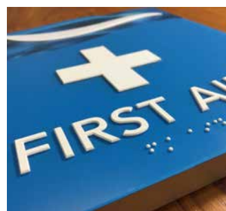
Caracteres en altorrelieve