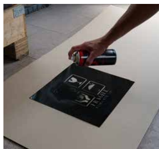
Plantillas para pintar